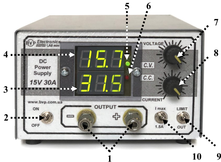
Мал. 2. Розташування органів управління на передній панелі джерела живлення