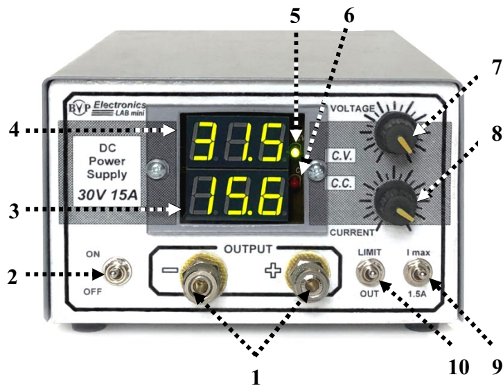
Мал. 2. Розташування органів управління на передній панелі джерела живлення