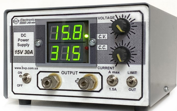
Рис. 1. Импульсный источник питания постоянного тока Lab Mini 15V 30A