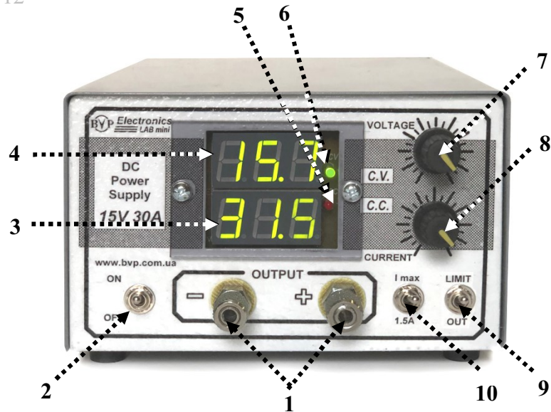
Рис. 2. Расположение органов управления на передней панели источника питания